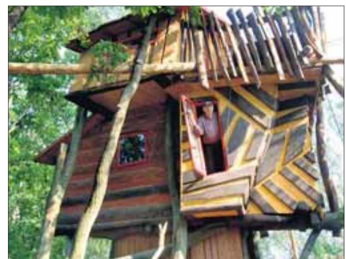
Ein kleines Abenteuer inmitten der Natur: Dieser Wunsch erfüllt sich im Baumhaushotel des Freizeitparks „Kulturinsel Einsiedel“ in der Nähe von Görlitz. Die luftige Herberge inmitten von Robinienstämmen schwebt circa zehn Meter über dem Erdboden.