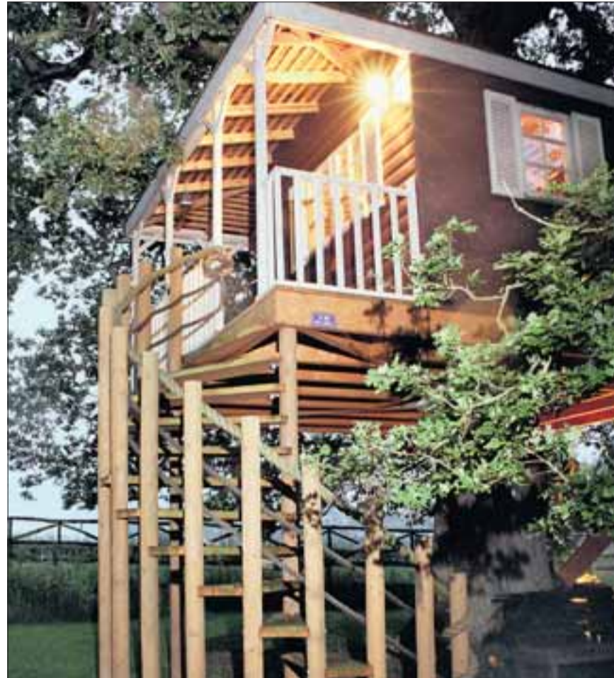
Die Dinge von einer höheren Warte aus betrachten und dabei auch modernen Wohnkomfort genießen: Dieses Baumhaus in der englischen Grafschaft Sussex bietet beides.