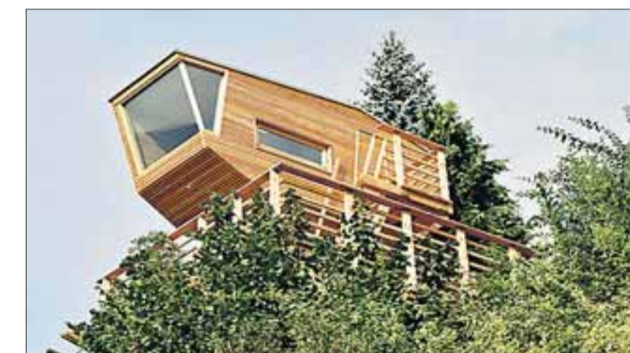
Wie ein Ufo wirkt Mirko Bogatajs Baumhaus aus heimischem Lärchenholz. Doch es ist nicht zufällig gelandet – dahinter steckt ein ausgeklügeltes Architekturkonzept: Das luftige Domizil ist wetterfest und bietet innen ein besonders gesundes Raumklima.

Besondere Lichteffekte bewirken die Innen- und die Außenbeleuchtung in der Dunkelheit. Sie kann sowohl von innen als auch vom Boden aus variabel geschaltet werden. Lars Klaaßen